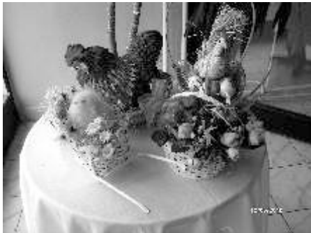
Obyvatelmi vlastnoručne vyrábané dekoratívne predmety, ktoré môžeme vidieť vo vitríne DD.

Klienti sa v zariadení často stretávajú v spoločenskej miestnosti, kde spoločne oslavujú svoje sviatky, pozerajú filmové rozprávky, biblické príbehy, počúvajú hudbu, čítajú rozprávky a príbehy. Mnohí sa zapájajú aj do brigád pri úprave okolia zariadenia, okopávajú kvety a starajú sa o balkónové kvety.